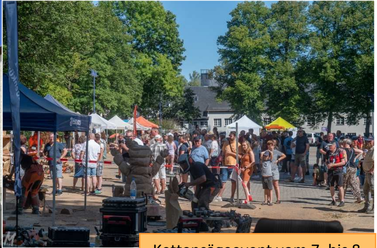
Kettensägeevent vom 7. bis 8. September auf dem Festplatz