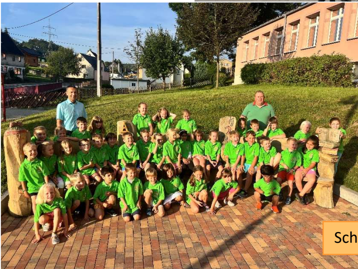
Schulanfang am 3. September im Volkshaus