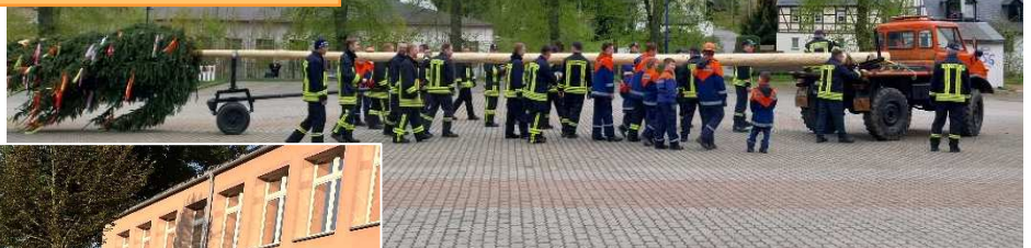
Maibaumsetzen am 27. April auf dem Festplatz