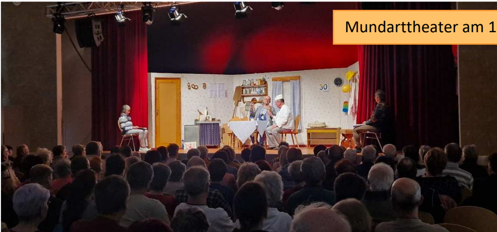
Mundarttheater am 10. März im Volkshaus

Grund zum Feiern gab es auch 2024 wieder – Ein kleiner Rückblick in Bildern: