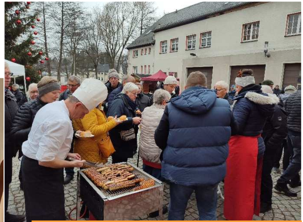
Weihnachtsmarkt vom 14. bis 15. Dezember auf dem Rathausplatz