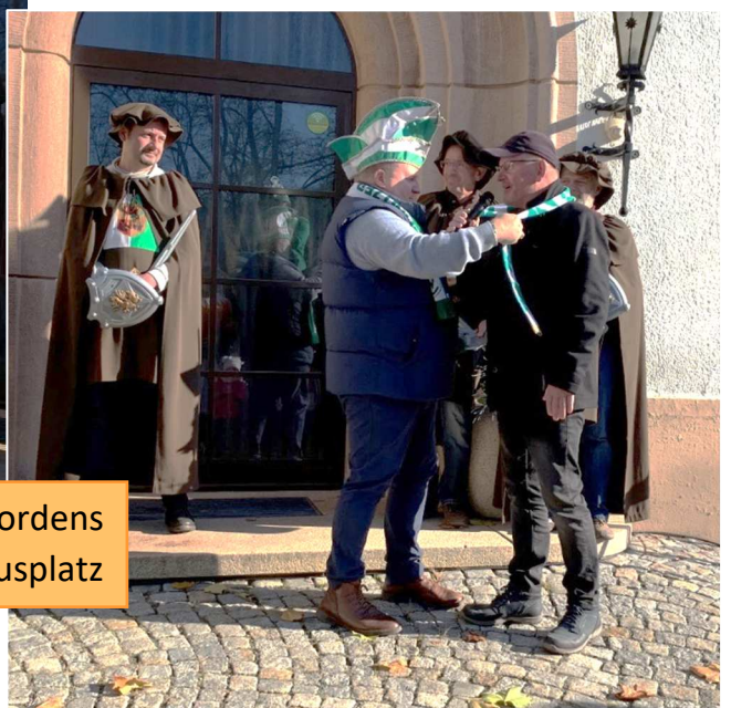
Rathausstürmung mit Verleihung des Strumpfordens am 10. November auf dem Rathausplatz