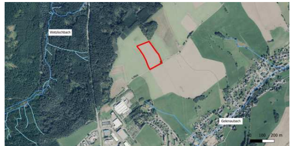
rot markierte Fläche = Planfläche

Erneuerbare Energien sind weiterhin wichtige Stromquellen in Deutschland und ihr Ausbau ist eine zentrale Säule der Energiewende. Auch in Gelenau wird dieses Thema über weitere Jahre hinweg präsent sein. Im Jahr 2024 begannen die Planungen einer Photovoltaikfreiflächenanlage mit einer Leistung von bis zu 3,33 MWp auf einer Fläche von ca. 2,40 ha auf einem in Privatbesitz befindlichem Grundstück. Dafür ist seitens der Gemeinde die Aufstellung eines Bebauungsplans notwendig, um die Umsetzung ab dem Jahr 2025 zu gewährleisten.