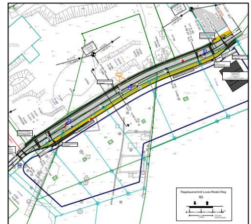
Foto aus Entwurfs-/Genehmigungsplanung von Ingenieurbüro Gerlach

Die Nachfrage nach Grundstücken in diesem Gebiet zum Eigenheimbau ist weiterhin vorhanden, so dass sich an dieser Stelle ein angenehmes Wohnumfeld entwickeln kann.