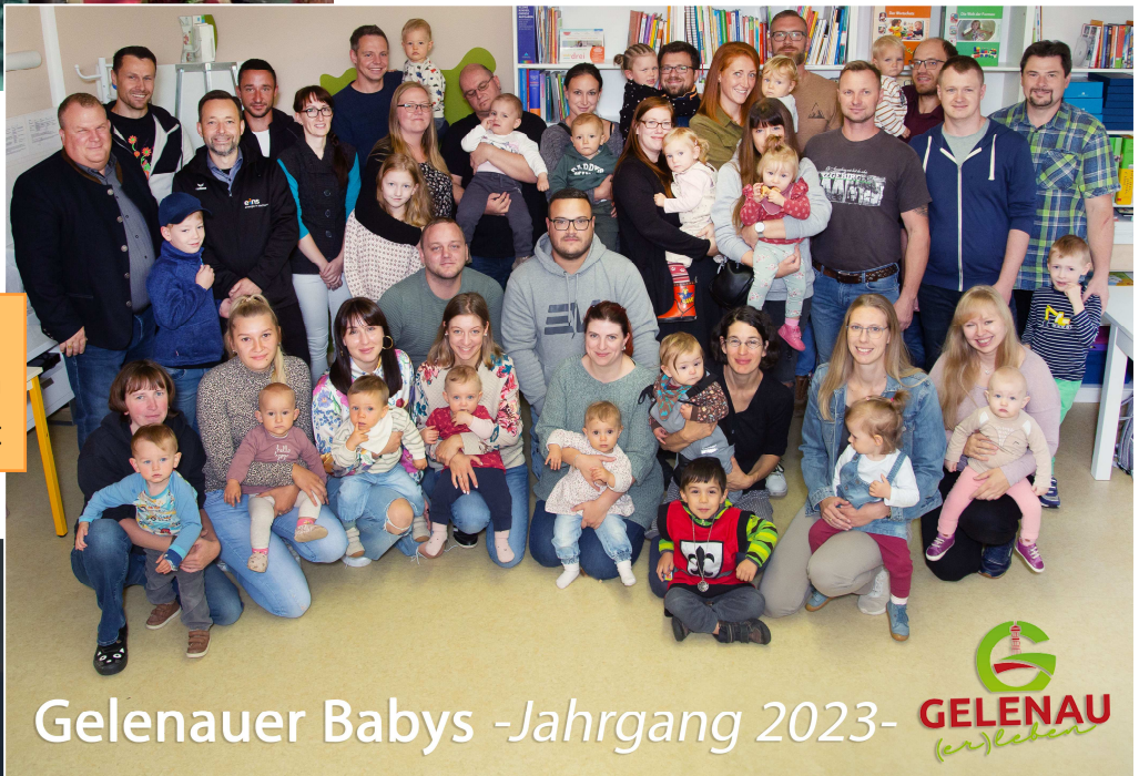
Babybegrüßung am 14. September in der Kita Kunterbunt