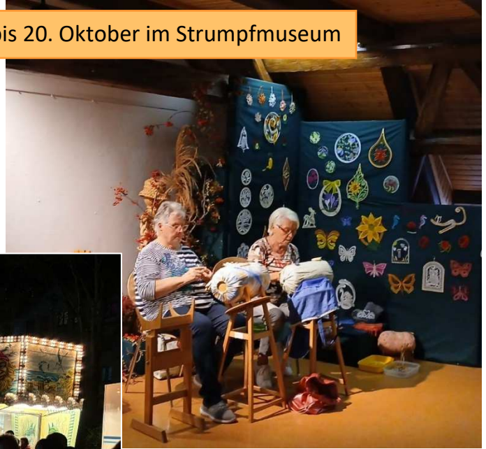
Tag des traditionellen Handwerks vom 18. bis 20. Oktober im Strumpfmuseum