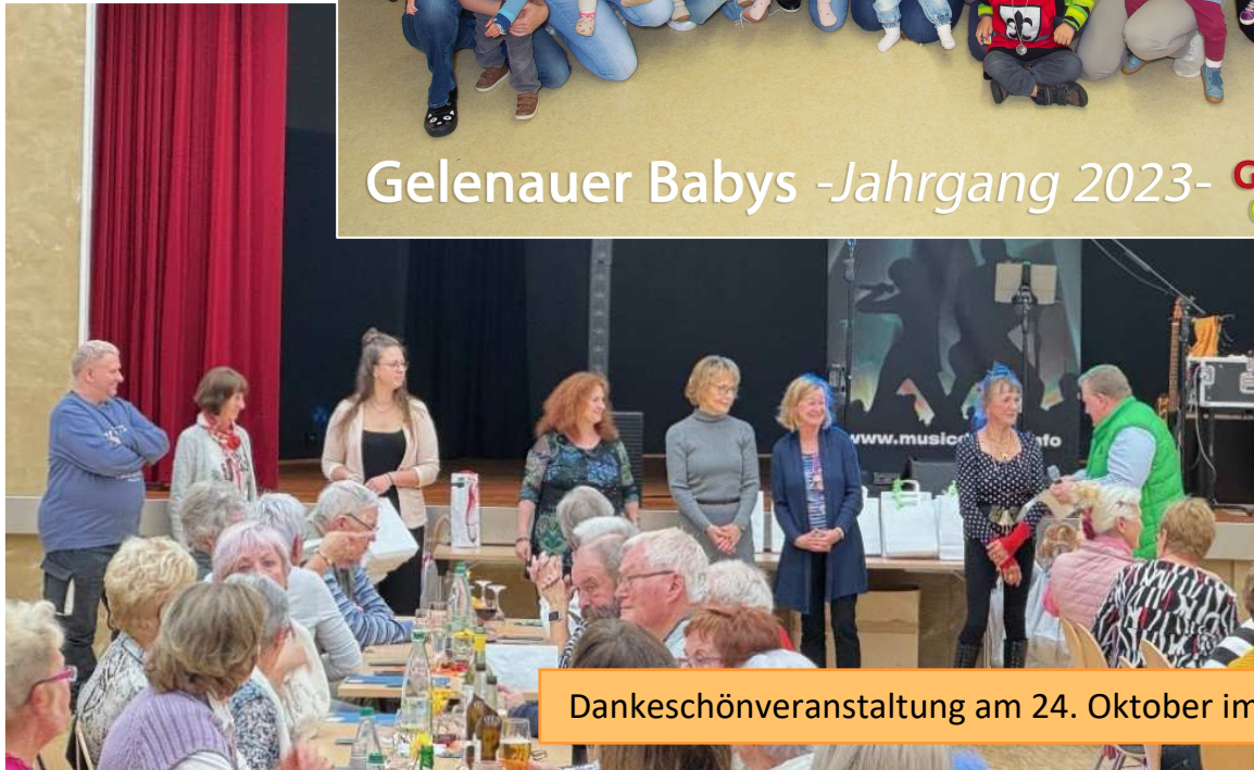
Dankeschönveranstaltung am 24. Oktober im Volkshaus