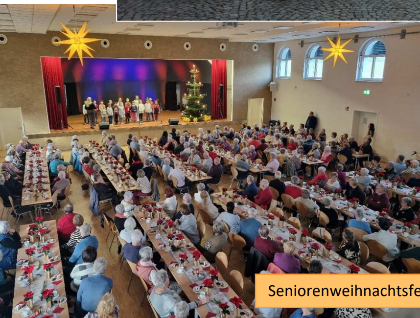
Seniorenweihnachtsfeier am 3. Dezember im Volkshaus