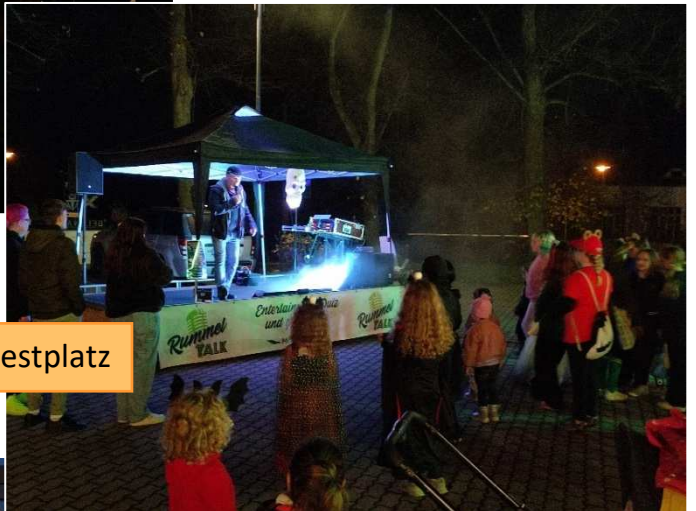
Halloweenparty am 31. Oktober auf dem Festplatz