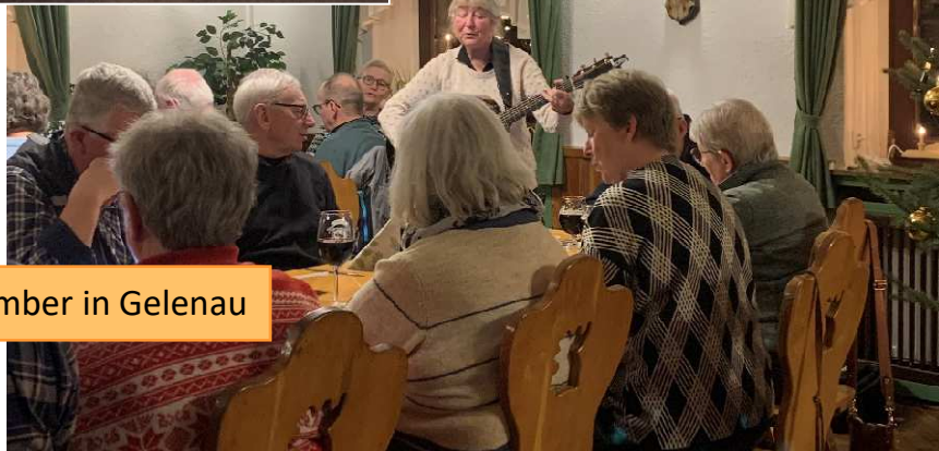
Besuch der Dänen am 14. Dezember in Gelenau